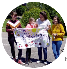
« Equipe Sucrées Salées » Equipe de collégien·nes.